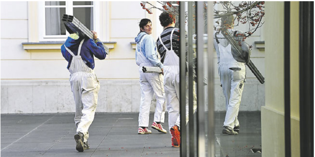
Srđan Vrančić / EPH

Više od milijun ljudi u dobi od 20 do 64 godine lani nije radilo - njih 300 tisuća tražilo je posao, a 750 tisuća bilo je potpuno neaktivno